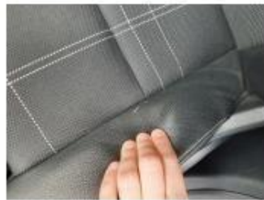
Переднее левое сидение