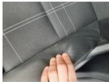
Переднее левое сидение