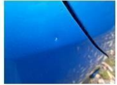
Заднее правое крыло