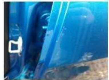
Дверь задняя левая