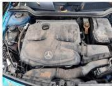
Дверь передняя левая