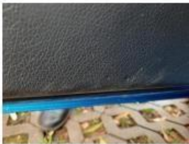
Обшивка водительской двери