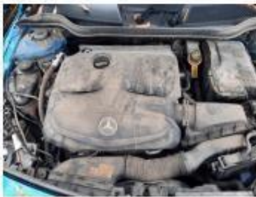
Дверь передняя левая