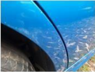
Заднее правое крыло