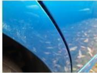
Заднее правое крыло